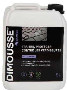
Ref. 444 100 DIMOUSSE 2.0 Prêt à l'emploi anti-verdissures

Nos produits compatibles DIMOUSSE Booster prêt à l'emploi :