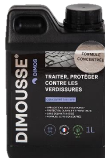
Ref. 444 120 DIMOUSSE X-Thallo concentré anti-mousse, algues, lichens