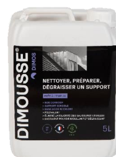
Ref. 444 160 DIMOUSSE Clean 2 en 1