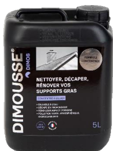
Ref. 444 170 DIMOUSSE Dégraissant concentré