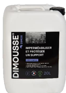
Ref. 444 150 DIMOUSSE Hydro